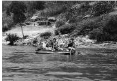
それを、あざ笑う神大生