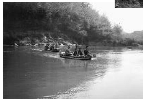
矢切りの~わた~し~ 人さらいのようにも見えるんですけど、、、(編)