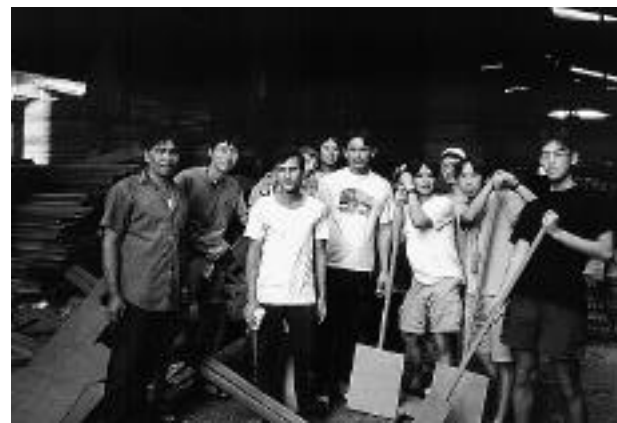
ありがとう・材木屋さん

翌日空港から出た途端熱気に襲われる。昨夜クーラーの効いた館内で寝ていたのに「タイもそんなに暑くないな」と勘違いしていたのだった。目の前のドンムアン駅までボートを持っていったときには皆すっかり汗だくになった。やって来たバンコク・ファランボーン行きの列車はやたらと込んでおり、でかい荷物を持った八人組は肩身の狭い思いをしたうえ車掌にしっかりボートの荷物料とし