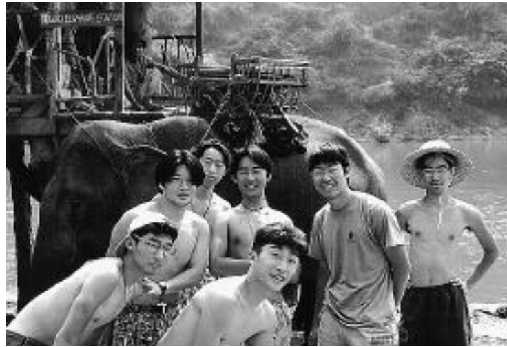
寛は？カレン族の村で

5日も出発は10時半と遅かった。川は完全に平野部へ出てしまったので流れがほとんどなくうんざりした。この状態が続くのかと思うとチェンライから下を下るのにやや不安を覚えた。14時半久々の都会チェンライに到着。一旦ボートをたたみ宿へ。Mr. Bは「じゃ、後は頑張ってくれ、幸運を祈る。」といてあっさり帰ってしまった。宿で今後のリバーツーリングについて話し合ったが、川下りに少し嫌気が差していた者とどうしてもメコンの合流点まで行きたい者の互いの思惑が錯綜した。6・7日は休息、情報収集、食料などの調達に当てた。TATによるとチェンライの下7キロのところにダムがあるということだった。