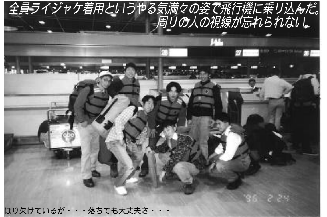
全員ライジャケ着用というやる気満々の姿で飛行機に乗り込んだ。周りの人の視線が忘れられない。ほり欠けているが・・・落ちて大丈夫さ・・・