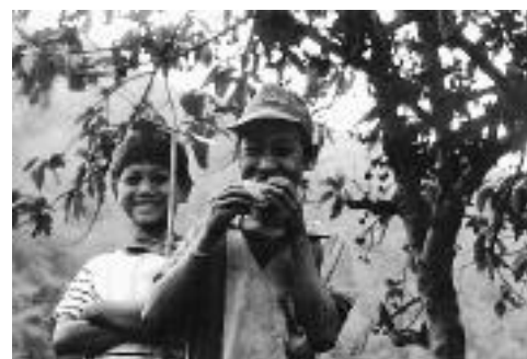
タイで、鯛焼ってなんやねん

ある。飯の後、下が芝生なので焚火はやめにしてゴロゴロ寝そべっていると子供たちがやって来て我々を取り囲んだ。そして笑いながら口々に何かしゃべるので、我々がおうむ返しにいうと喜んでた。最初は遠巻きにしていた彼らだったが、段々近づいて来て騒いだ。そこで我々は一同に立ち上がって子供たちを追い掛け回し、彼らは歓声を上げて逃げ回った。大学生と子供の追い掛けっこは2・3回続き、生意気なやつをとっ捕まえたりしていたが渡れてテントに引き上げた。しかし子供たちはなかなか帰ろうとせず遅くまで騒いでいた。